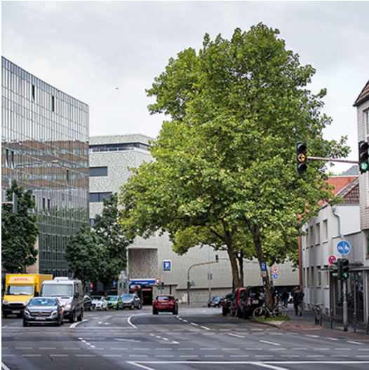
Sehen gesünder aus, als sie sind: Stadtbäume in der Innenstadt

Die Luft ist schlecht, der Boden verdichtet, das Wetter extrem. Nie hat Köln dringender Bäume gebraucht. Ihr Bestand aber ist bedroht