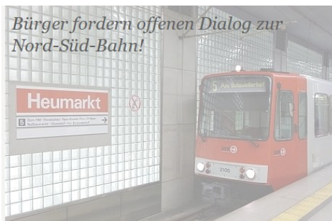
Kaum Interesse für Probleme im Bezirk!

Rodenkirchen. Sind Mittel- und Zeigefinger auf dem Rücken der Kommunalpolitiker gekreuzt, wenn mit der anderen Hand abgestimmt wird? Das Muster ist bekannt: Die Bezirksvertretung Rodenkirchen lehnte z.B. am 31.03.2014 den Neubau einer sechsstöckigen Parkpalette an der Bonner Straße ab. Der Stadtentwicklungsausschuss – zunächst Klärungsbedarf signalisierend (oder sollten die Wähler bei der Kommunalwahl am 25.05.2014 nur nicht verschreckt werden?) – kippte den Ablehnungsbeschluss am 25.09.2014 , und zwar ohne weitere inhaltliche Diskussion.